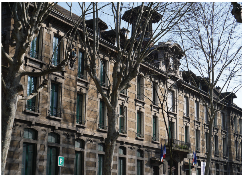
Prise de vue - façade Boulevard Anatole France.

• Le bâtiment A1 est l'entrée principale du lycée Boulevard Anatole France. Ce bâtiment de 53.5 ml de façade est assez représentatif de l'ensemble des façades. L'escalier monumental est en pierre Villebois, les soutènements à bossage en pierre de St Martin de Belleruche, l'élévation au-dessus de la première corniche est constituée d'une alternance de pierre de St Martin de Belleruche en moellons parfaitement brochés et d'encadrement en pierre de St Restitut. Ces élévations sont particulièrement sales, il y a peu de pathologie sur la pierre en partie courante, les désordres sur la pierre sont concentrés sur la corniche haute. De ce fait, il conviendra au moment d'affiner les devis de faire une intervention à la nacelle afin de sonder les corniches en pierre et finaliser le diagnostic.