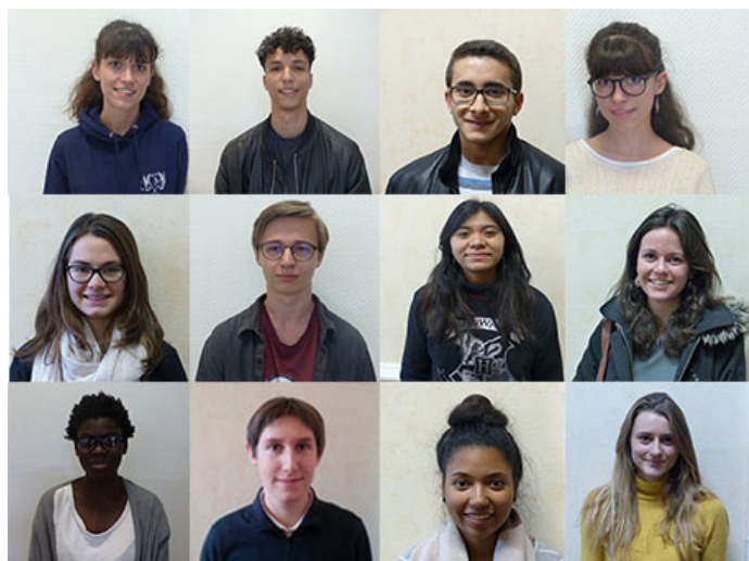
Quelques élèves aidés par la Fondation Lycée du Parc...

Total besoin de financement ouverture sociale pour 1 an : 86 000 €